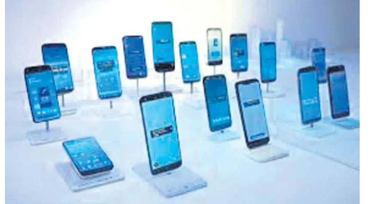
విలుపు ఐదు శాతం పడిపోయింది. సర్వేలో పాల్గొన్న వారిలో ఆరు శాతం మంది సెకండ్ హ్యాండ్ మొబైల్స్ కొనుగోలు చేయడానికి ఆసక్తి చూపారు.