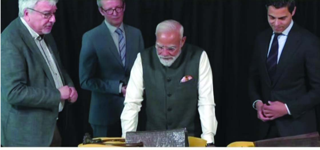
ANCIENT COPPER PLATES FROM THE CHOLA PERIOD...