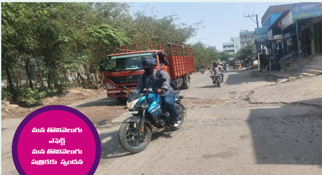
మన తొలివెలుగు ఎఫ్ఐకే మన తొలివెలుగు పత్రికకు స్పందన

నడుములు విరగొట్టే గుంతలు.. యమ డేంజర్ గా మారిన రహదారి