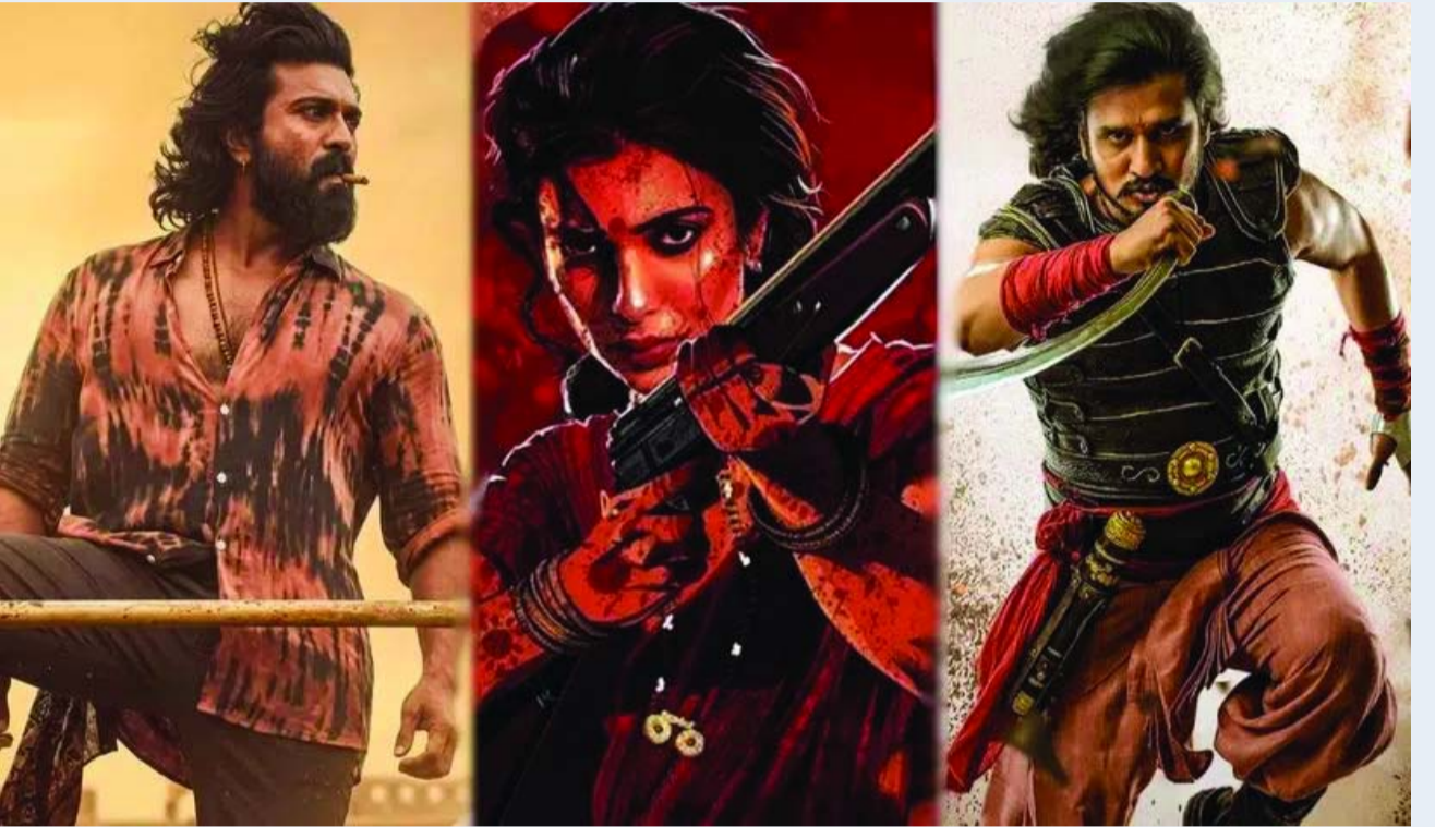
సిద్ధమవుతున్నాయి. ఇక వీటిలో ఏ సినిమా బాక్సాఫీస్ వద్ద సంచలనం సృష్టిస్తుందో చూడాలి.

2026 జూన్ నెల టాలీవుడ్ బాక్సాఫీస్ కు భారీ వినోదాన్ని అందించేందుకు సిద్ధమవుతోంది. విభిన్న జోనర్ లో తెరకెక్కిన సినిమాలు వరుసగా థియేటర్ లోకి రానుండటంతో సినీ అభిమానుల్లో ఆసక్తి నెలకొంది. ముఖ్యంగా స్టార్ హీరోల చిత్రాలు, హీరో కామెడీలు, ఫ్యామిలీ ఎంటర్ టైన్ మెంట్, స్పోర్ట్స్ డ్రామాలు ఇలా అన్ని రకాల సినిమాలు ఈ నెలలో ప్రేక్షకులను అలరించబోతున్నాయి. జూన్ మొదటి వారంలోనే టాలీవుడ్ బాక్సాఫీస్ కు భారీ ఊపు రానుంది. జూన్ 3న 'అసురాసుర' సినిమా విడుదల కానుంది. యాక్షన్, డ్రైల్లర్ ఎలిమెంట్స్ తో తెరకెక్కిన ఈ మూవీపై ప్రేక్షకుల్లో ఆసక్తి కనిపిస్తోంది. ఇక జూన్ 4న మెగా పవర్ స్టార్ రామ్ చరణ్ నటించిన భారీ పాన్ ఇండియా చిత్రం 'పెద్ది' థియేటర్ లోకి రానుంది. ఇప్పటికే ఈ సినిమాపై అంచనాలు తారాస్థాయికి చేరుకున్నాయి. డ్రైల్లర్, డీజర్లు సోషల్ మీడియాలో భారీ హైప్ క్రియేట్ చేశాయి. జాస్మిన్ కపూర్ హీరోయిన్ గా నటించిన ఈ చిత్రంలో యాక్షన్, ఎమోషన్, స్పోర్ట్స్ బ్యాక్ డ్రాప్ ప్రధాన ఆకర్షణలుగా ఉండనున్నాయి. అదే వారంలో జూన్ 5న 'రావ్ బహదూర్' విడుదల కానుంది. అలాగే హాబీవుడ్ ఫాంటసీ యాక్షన్ చిత్రం 'మాస్టర్స్ ఆఫ్ ది యూనివర్స్' కూడా అదే రోజున ప్రేక్షకుల ముందుకు రానుంది. దీంతో మొదటి వారంలోనే బాక్సాఫీస్ వద్ద మంచి పోటీ కనిపించనుంది. జూన్ రెండో వారం మాత్రం కాస్త నెమ్మదిగా ఉండనుంది. జూన్ 11న 'సంగీతం' అనే సినిమా మాత్రమే విడుదల కానుంది. సంగీతం ప్రధానంగా తెరకెక్కిన ఈ చిత్రంపై సంగీత ప్రేమిల్లో ఆసక్తి నెలకొంది. అయితే అనలు పోటీ మాత్రం జూన్ మూడో వారంలో కనిపించనుంది. జూన్ 19న